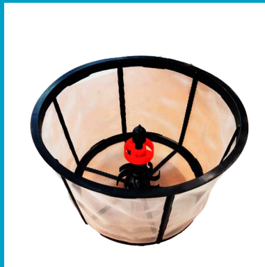
EINSPUELVORRICHTUNG MIT SIEB