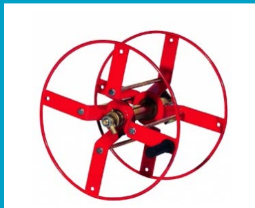
SCHLAUCHHASPEL F. 100 MT