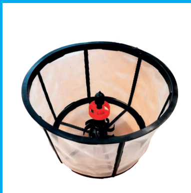
EINSPUELVORRICHTUNG MIT SIEB