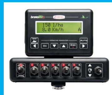
COMPUTER BRAVO 180S

Anhänge-Sprühgerät für den Einsatz in Wein- u. Obstgarten mit mittlerem oder großem Pflanzenabstand.