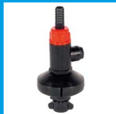
KIT POUR LE LAVAGE DES CISTERNES