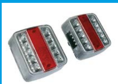
EQUIPMENT ÉLÉTRIQUE LED