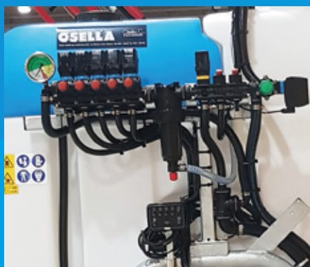
KIT COMMANDE ÉLECTRIC POUR DÉSHÉRBAGE