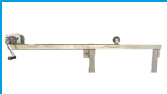
TREUIL DE RELEVAGE