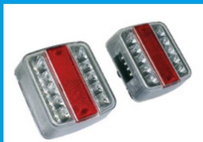
EQUIPMENT ÉLÉTRIQUE LED