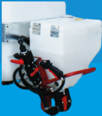
CHEMIESCHLEUSE MIT NTEGRIRTER GEBINDEREINIGUNG